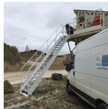
Réalisation escalier extérieur

AIA SOUDURE 71 av. de la Libération - 10140 Vendeuvre sur Barse Tél : 06 89 13 71 01