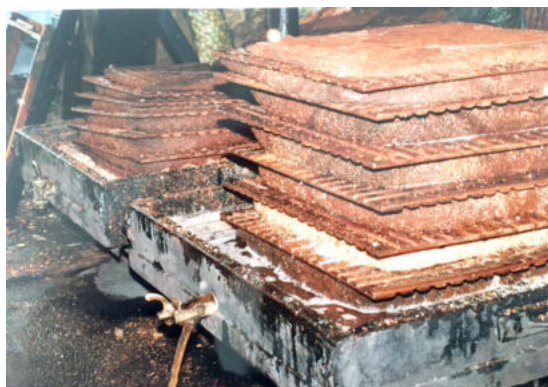
Les clayettes recouvertes de toile de jute.

Après avoir pris rendez-vous, les clients venaient avec leurs sacs remplis de pommes.