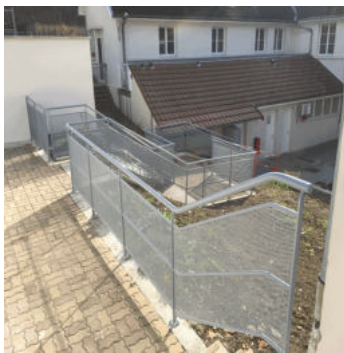
Fabrication et pose de rambarde