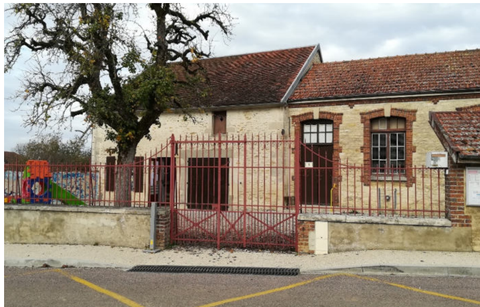
École maternelle de TRANNES

Malgré toutes ces précautions, plusieurs enfants « cas contact » ont été identifiés dans nos écoles ainsi qu'un enfant testé positif (sources au 20/11) ce qui cependant n'a pas entraîné pour le moment de fermeture d'écoles dans notre R.P.I.